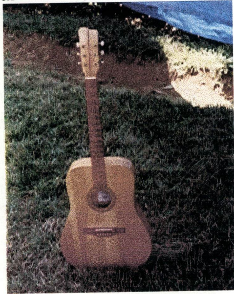
16. Guitare acoustique en cyprés