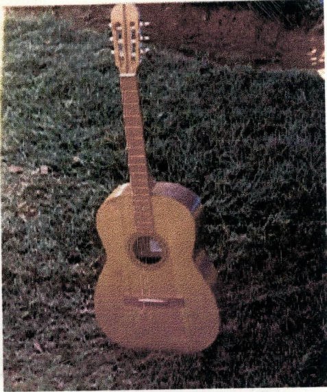
15. Guitare classique en triplex