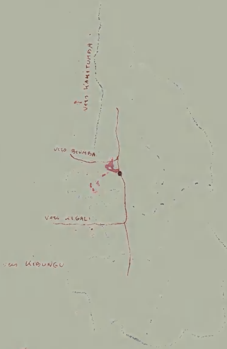
TERRITORIES OF KIRONSU.